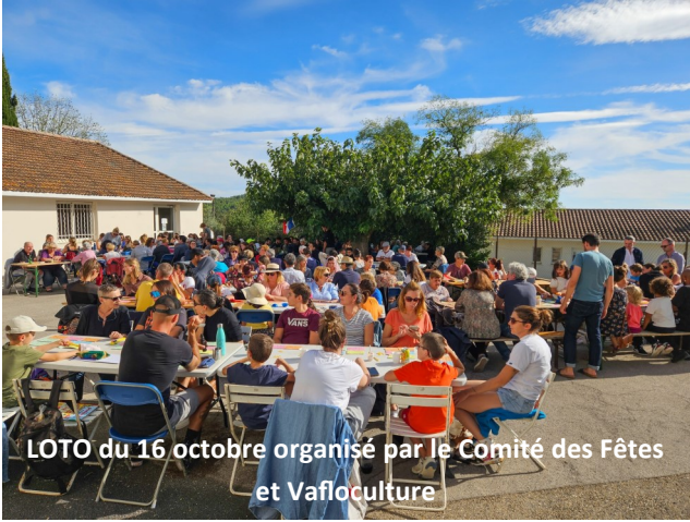
LOTO du 16 octobre organisé par le Comité des Fêtes et Vafloculture