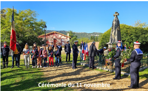
Cérémonie du 11 novembre