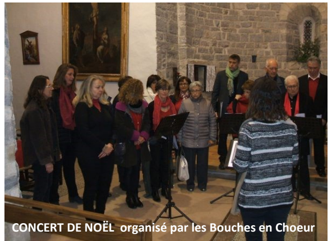
CONCERT DE NOËL organisé par les Bouches en Choeur