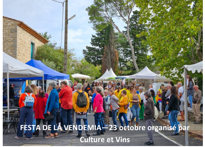
FESTA DE LA VENDEMIÀ— 23 octobre organisé par Culture et Vins