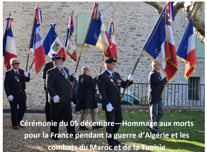
Cérémonie du 05 décembre—Hommage aux morts pour la France pendant la guerre d'Algérie et les combats du Maroc et de la Tunisie