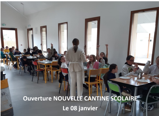
Ouverture NOUVELLE CANTINE SCOLAIRE Le 08 janvier