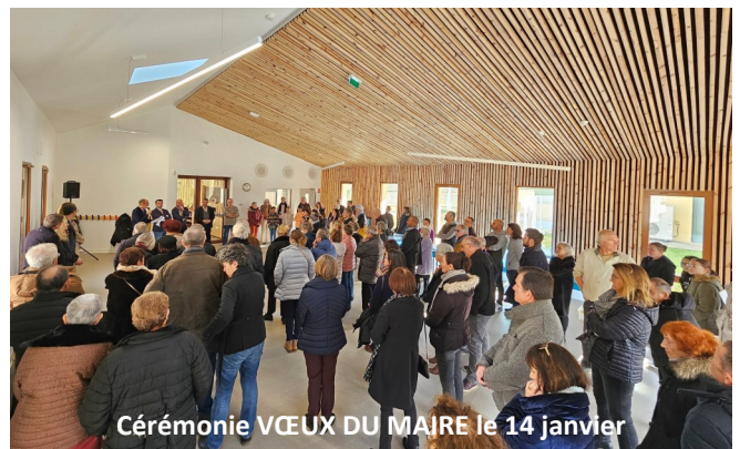
Cérémonie VŒUX DU MAIRE le 14 janvier