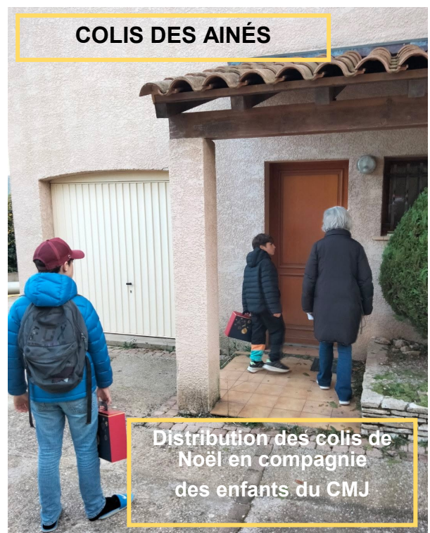
COLIS DES AINÉS