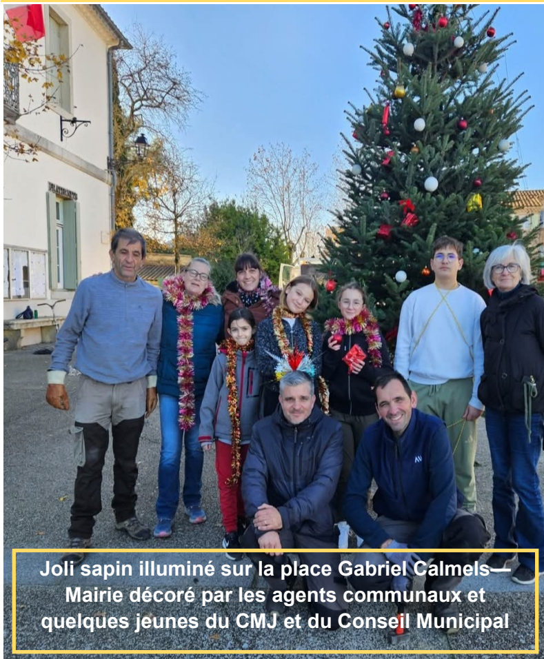
Joli sapin illuminé sur la place Gabriel Calmels— Mairie décoré par les agents communaux et quelques jeunes du CMJ et du Conseil Municipal