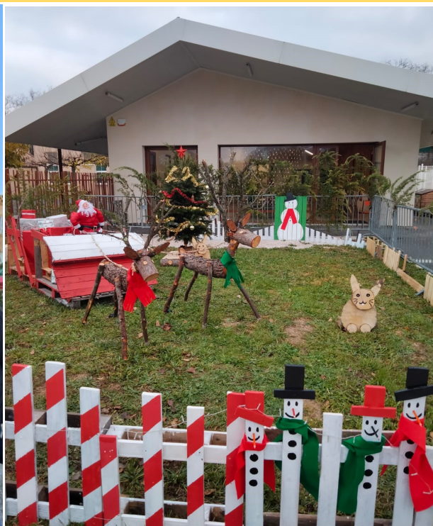
Village de Noël installé devant l'école Réalisé par les enfants du groupe scolaire avec la participation de l'ALAE et des agents du service technique